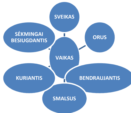
1 pav. Ikimokyklinio ugdymosi lūkesčiai

* SĖKMINGAI BESIUGDANTIS vaikas – tai turintis esmines nuostatas ir gebėjimus, siejamus su MOKĖJIMO MOKYTIS kompetencija ir pateiktus ugdymosi pasiekimų srityse: „ iniciatyvumas ir atkaklumas “, „ tyrinėjimas “, „ problemų sprendimas “, „ kūrybiškumas “ ir „ mokėjimas mokytis “. Šis lūkestis jungia esmines nuostatas ir gebėjimus, kuriuos santykinai galime pavadinti integraliaisiais, tai yra susijusiais su visais kitais ikimokyklinio ugdymo(si) lūkesčiais.